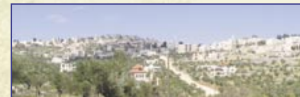
L'iniziativa mira in particolare a fermare l'emigrazione massiccia di cui soffre Taybeh.

Dei 3400 abitanti di trenta anni fa, non ne restano oggi più di 1500 a Taybeh.