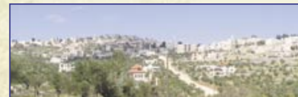
L'iniziativa mira in particolare a fermare l'emigrazione massiccia di cui soffre Taybeh.

Dei 3400 abitanti di trenta anni fa, non ne restano oggi più di 1500 a Taybeh.