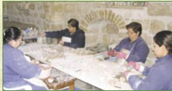
Les « lampes de la Paix » donnent du travail à une vingtaine de personnes

Cette initiative est un outil d'information important sur les conditions de vie auxquelles les communautés chrétiennes de Terre Sainte sont confrontées à cause du conflit.