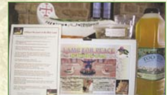
Contenu des kits de «lampes de la Paix»

Malgré l'attachement des villageois à leur Terre, ceux-ci sont poussés à tenter leur chance ailleurs, du fait des difficultés liées au conflit israélo-palestinien et du fait du manque de perspectives d'avenir.