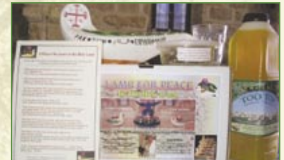
Contenu des kits de «lampes de la Paix»

Malgré l'attachement des villageois à leur Terre, ceux-ci sont poussés à tenter leur chance ailleurs, du fait des difficultés liées au conflit israélo-palestinien et du fait du manque de perspectives d'avenir.