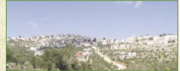
L'initiative vise tout particulièrement à enrayer l'émigration massive dont souffre Taybeh.

Sur les 3400 habitants d'il y a 30 ans, il n'en reste aujourd'hui plus que 1500 à Taybeh.