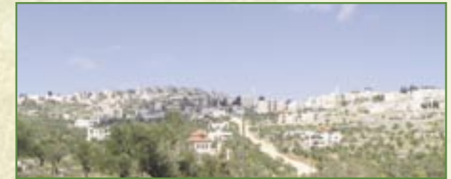
L'initiative vise tout particulièrement à enrayer l'émigration massive dont souffre Taybeh.

Sur les 3400 habitants d'il y a 30 ans, il n'en reste aujourd'hui plus que 1500 à Taybeh.